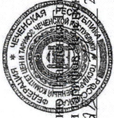
ТАБЛИЦА 2 к решению Государственного комитета цен и тарифов Чеченской Республики от « 27 » 2024 г. № 58-2